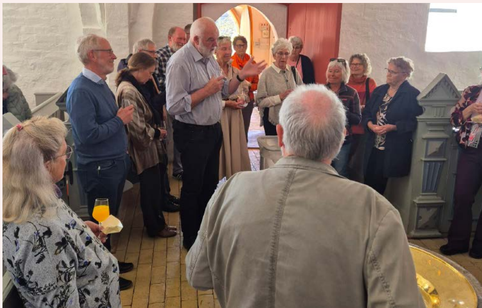
Afskedsreception for organist i Røsnæs kirke