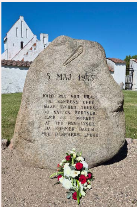
Kirken lagde blomster ved "5. maj stenen" på 80-årsdagen for 2. verdenskrig afslutning

Vi byder konfirmanderne og deres forældre velkommen.